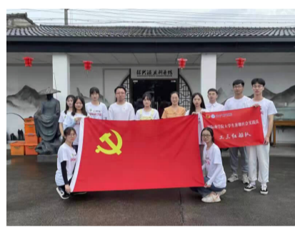
工商管理1901班成员合影

在班级的党团风貌中，他们现有党员1名，预备党员7名，入党积极分子4名，团员19名，群众1名，其中包含4名，党团员人数占比远远超过同阶段其他班级，优秀的党团员正在引领班级向着美好的未来发展。他们积极投身到志愿服务中去，工商管理1901班成员义工时总数达到9980.8h，人均义工时超过300h。在运动场上也挥洒着他们的“畅意青春”，两年里，班级中的同学代表学院在校运会中共获得团体和个人奖项14项。 他们班英语四级通过率达93.75%，六级通过人数也超班级总人数三分之一。计算机二级通过率达100%。优秀率达到62.50%。他们班大一学年绩点3.3以上有8人，大二学年绩点3.3以上有16人，同比翻一番；其中大一学年绩点3.5以上有3人，大二学年绩点3.5以上达9人，同比翻了三倍。两年来，班级同学累计获得院级学科竞赛奖项99项，校级学科竞赛奖项73项，市级学科竞赛奖项2项，省级学科竞赛奖项73项。学生获省级及以上的论文五篇和一项国家级专利技术，总计各类竞赛、立项达到了200余项。