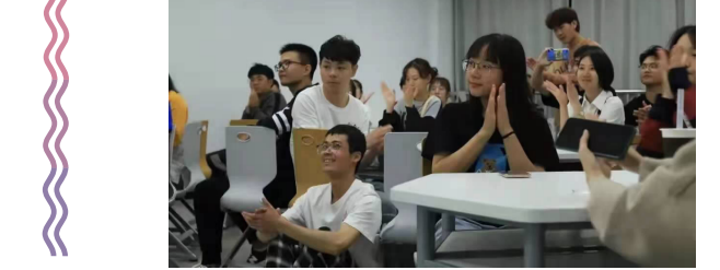
网络与新媒体(中外合作)2003班成员合影

大一学年本班SPT学生数，占全班人数的90%，并被学校评为SPT班级。在2020-2021学年的奖学金评选之中，班内有4位同学获得了SPT奖学金，占学院奖学金总人数25%以上，有2位同学获得省政府奖学金，占学院省政府奖学金获得者总人数33%以上，2位同学被评为励志SPT奖学金获得者，各由1位同学被评为优秀SPT学生一、二等奖学金获得者，5位同学被评为优秀SPT学生三等奖学金获得者。班级有4名同学参加了学院20级同学自发组建的“吾肆”工作室，共同参与了学院第一部招生宣传片的拍摄制作，深受师生的好评。截止到大二第一学期，班级内已有22名同学向党支部递交了入党申请书，15名同学参加了学院的第一期业余党校学习，6名同学列为学院第一批入党积极分子。