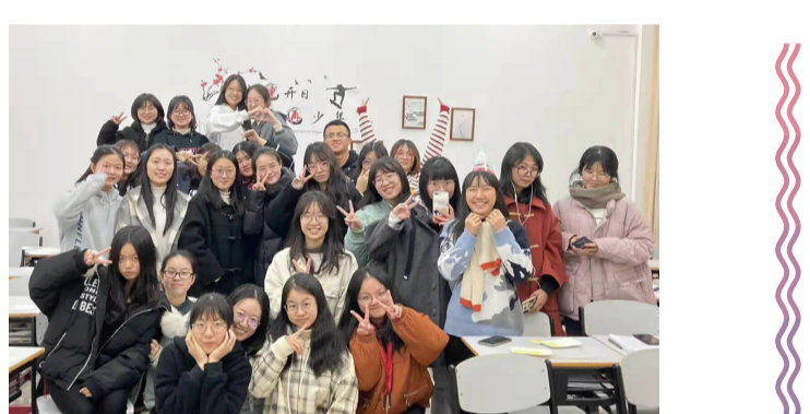
汉语国际教育1902班成员合影

本学年班级SPT学生数32人，SPT学生率达100%，获评2020-2021学年优秀SPT班级。成绩绩点3.3及以上人数14人，占比43.75%。截至目前，本班英语四级通过率达96.97%，在同年级同专业中排名第一；英语六级通过率为28.13%，计算机二级通过率达到90.63%；普通话二甲及以上达标率达到75%。班级成员共获得2021年国家奖学金1人，获得省政府奖学金、校SPT奖学金等19人次。班级成员获得国际级奖项1项，国家级奖项18项，省级奖项14项，市级奖项21项，校级奖项58项，学院级奖项114项。班级成员已获得创新创业项目立项10项(国家级2项、省级5项、校级3项)，立项参与学生数达21人，占比65.63%。 班内同学利用假期赴云南、丽水山区支教，所在团队获评2020年浙江省暑期社会实践优秀团队，为乡村儿童建设公益图书馆；课余时间参与绍兴市北海小学第二时段课后志愿服务。