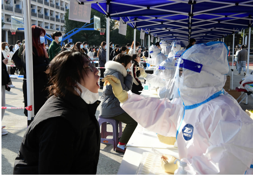
文/大学生传媒中心

下一步,我校将继续采取各项措施,从严从紧从实从细做好各项防控工作,筑牢校园疫情防线。相信在上级部门的关心指导下,经过全体师生的共同努力,我们终会打赢疫情防控这一场硬仗。没有一个冬天不可逾越,没有一个春天不会来临。16日,我校进行第二次核酸检测,结果全部为阴性。