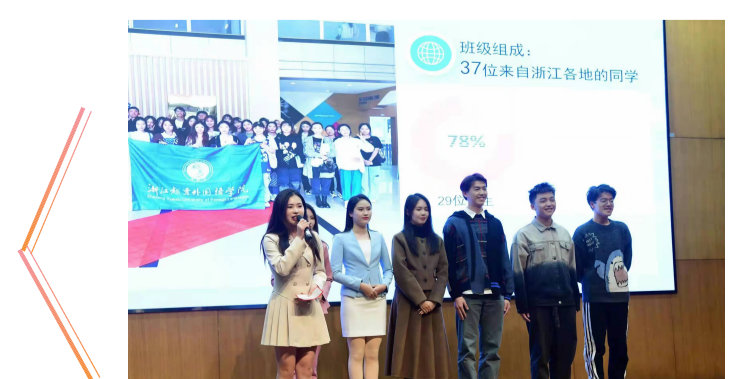
播音与主持艺术专业2101班成员合影

学院首届播音与主持艺术新生班，以专业优势、班级获奖荣誉，参与竞赛突出，代表学院参赛。作为唯一一个新生班级代表，播音班的学生们积极备赛。从清晨7:00的早读开始，31位女生，8位男生，迎着初升的太阳，准时出现在艺术学院大门口进行早功练习，带动了整幢楼的早读氛围。其中两位同学自发运营的短视频账号，在短短的几个月时间里获得了几十万点赞，将专业知识运用到实践中，收获了不少好评。学生们在班主任辅导员及任课老师的带领下，短短的一学期内创办短视频和双语播音社团，参加绍兴市越地儿女直播培训、担任迎亚运志愿讲师、参与校庆40周年文创义卖，又在运动会、英语口语比赛、军训“爱我国防”演讲比赛、直播带货比赛中崭露头角，处处洋溢着播音学生的自信与活力。面对专业学习，他们怀抱热忱，一丝不苟。面对课余生活，他们奋发向上，勇于创新。 作为新建学院，学院领导与老师将着力建设良好学风，为学生学习成长营造良好气候，创造好生态，并将思想政治工作能润物无声，给学生以人生启迪、智慧光芒和精神力量。